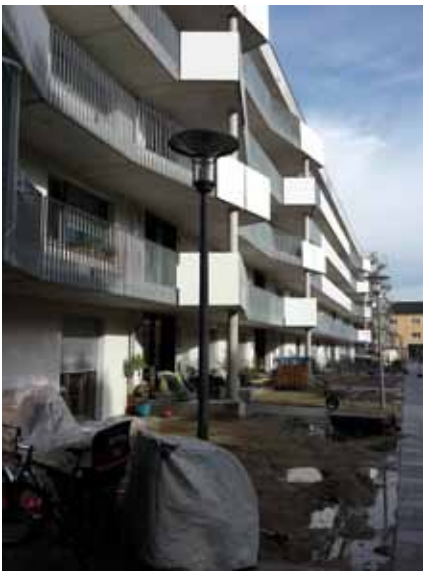
Unser Haus am Reinmarplatz von allen Seiten betrachtet