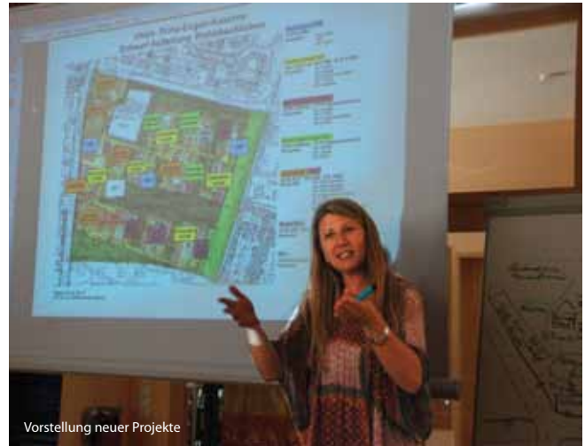
Vorstellung neuer Projekte

schaftliches Risiko bergen (Beispiel: Wien „Seestadt“). Wichtig wäre eine Anschubfinanzierung (SoBoN für Gewerbe), zur Überbrückung der Zeit bis viele Menschen (KundInnen) die Siedlung bewohnen.