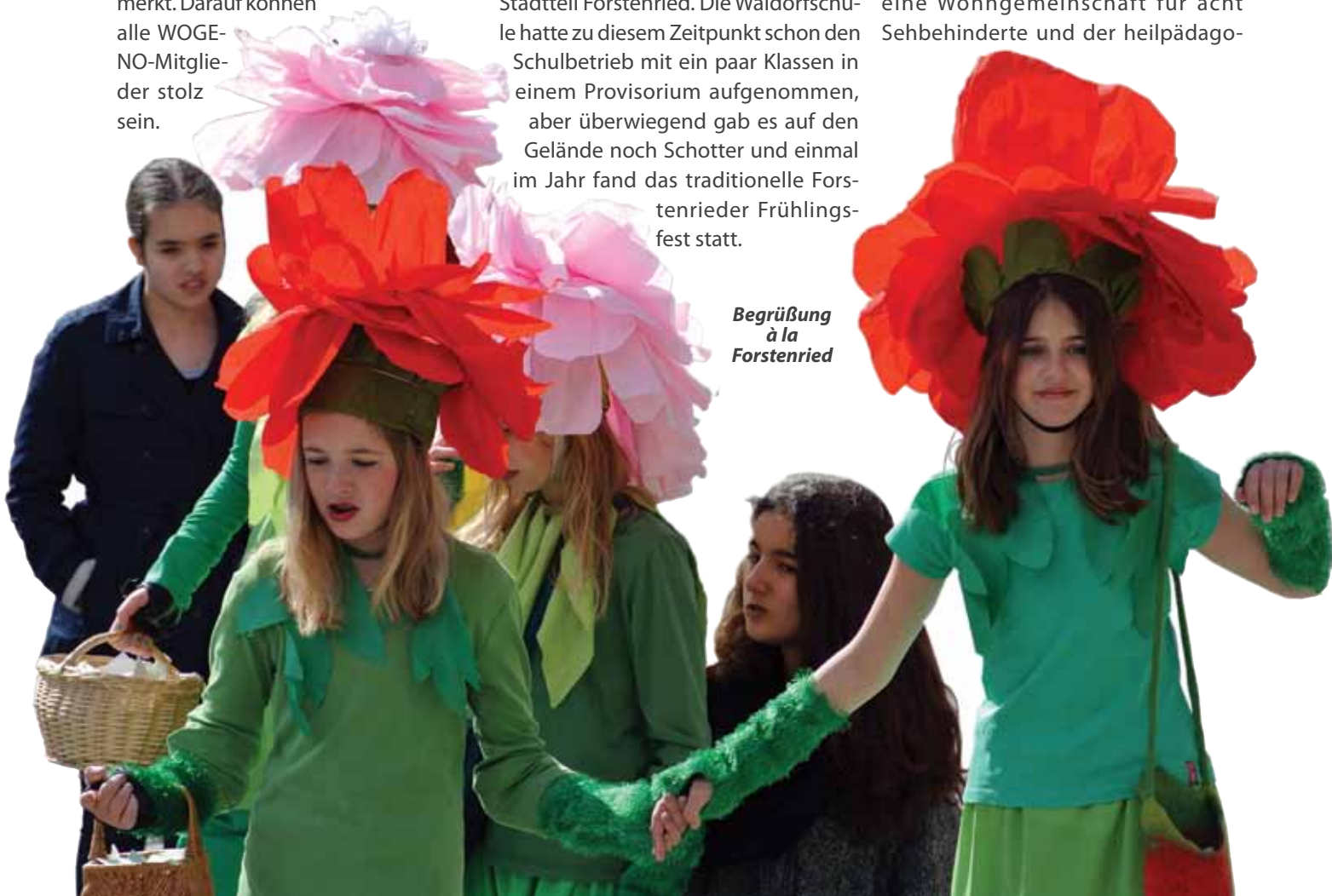
Begrüßung à la Forstenried

Besonders froh sind wir über die entstandenen drei Wohngemeinschaften. Die Südbayerische Wohn- und Werkstätten für Blinde und Sehbehinderte gGmbH (SWW) betreibt eine Wohngemeinschaft für acht Sehbehinderte und der heilpädagogischen