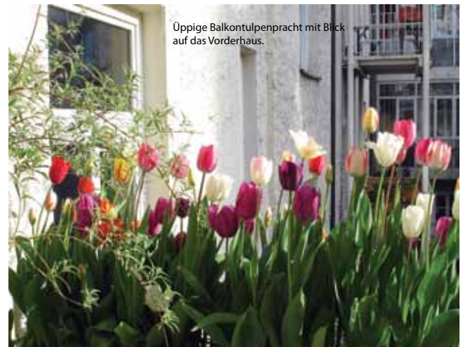
Üppige Balkontulpenpracht mit Blick auf das Vorderhaus.