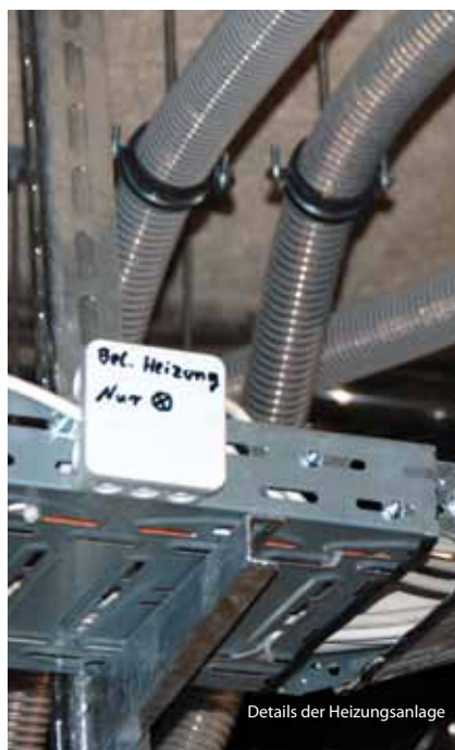
Details der Heizungsanlage