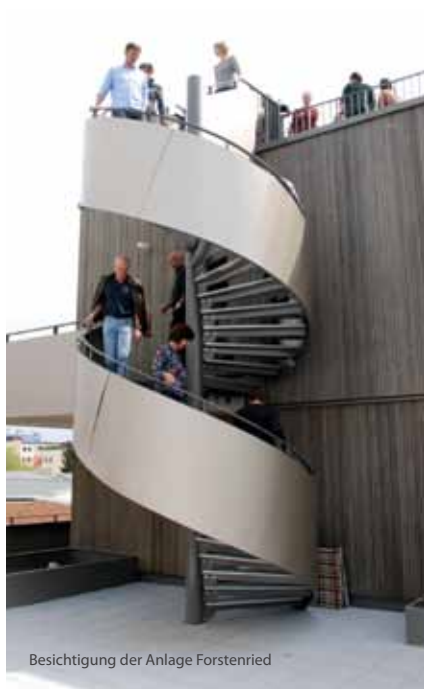
Besichtigung der Anlage Forstenried